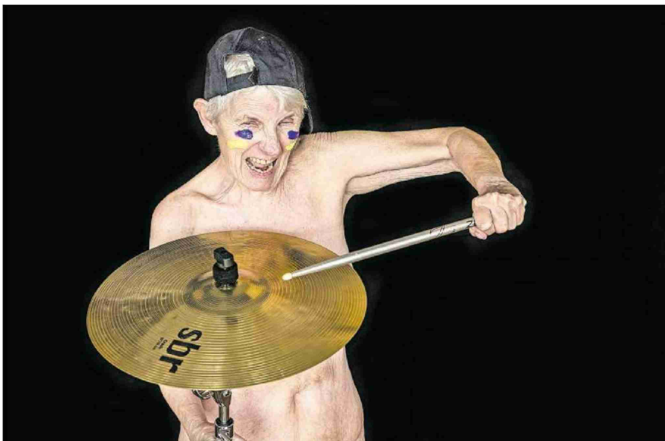
Selbstbewusst: Die Frauen der Grossmütter-Revolution brechen mit dem Klischee der angepassten alten Oma.

Die Frauen der Grossmütter-Revolution lassen für einen Kalender die Hüllen fallen. Sie wollen den alten Frauenkörper enttabuisieren.